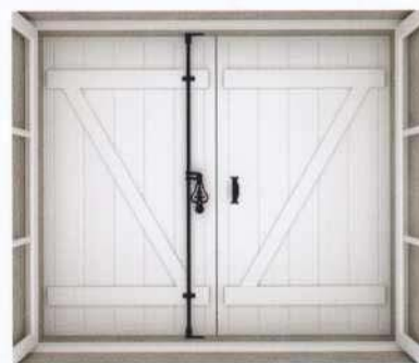
Vue de l'intérieur sans traverses