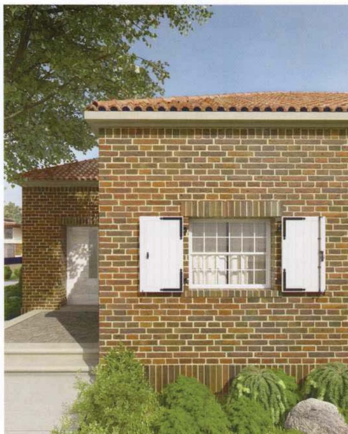
Vue extérieure avec traverses en bas